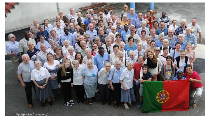
Rassemblement à Tours