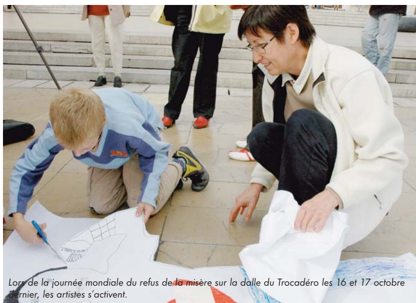
Lors de la journée mondiale du refus de la misère sur la dalle du Trocadéro les 16 et 17 octobre dernier, les artistes s'activent.