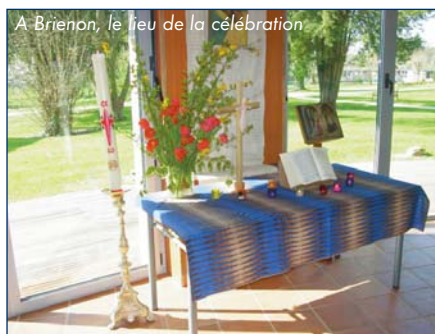
A Briennon, le lieu de la célébration

Le 9 avril, en Afrique, les Sœurs se sont retrouvées pour accueillir leur nouvelle coordinatrice, Sœur Claire Patéroux, et leur nouveau conseil.